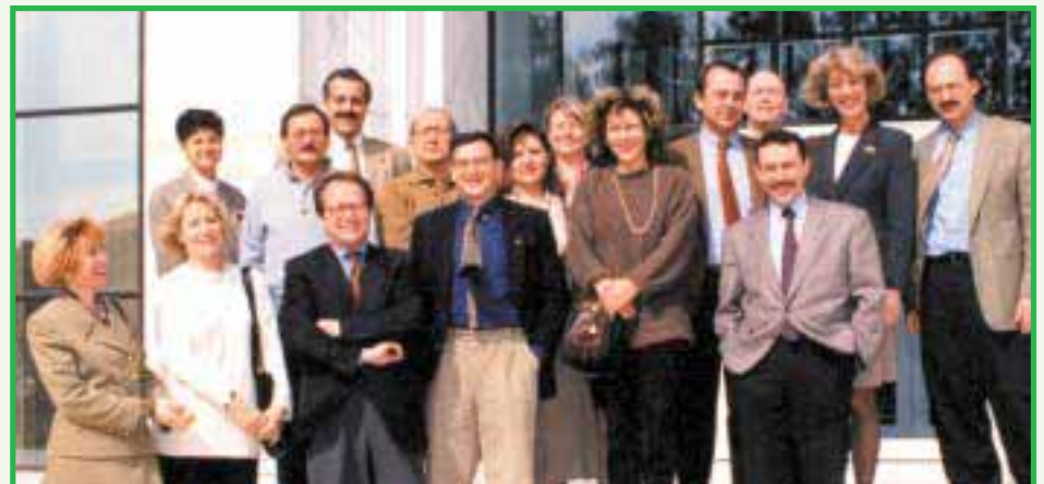
Η Ομάδα Διοίκησης Έργου του Premeq I

Για την υλοποίηση του έργου δημιουργήθηκαν εθνικές και διακρατικές ομάδες εργασίας ενώ τον κεντρικό συντονισμό και την εποπτεία της υλοποίησής του είχε ειδική Ομάδα Καθοδήγησης του έργου ( Steering Committee ), που συγκροτήθηκε και λειτούργησε στο πλαίσιο του ΙΝΕ/ΟΤΟΕ.