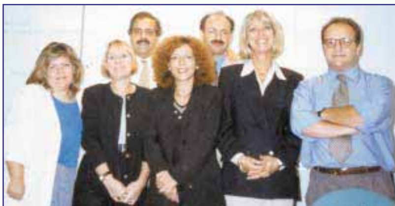
Η Ομάδα καθοδήγησης του Premeq I

Στον ευρωπαϊκό χώρο, η οικονομική και νομισματική ένωση και η εισαγωγή του ενιαίου νομίσματος, δημιουργεί ένα εντελώς διαφορετικό σκηνικό για το χρηματοοικονομικό χώρο και ιδιαίτερα για τις τραπεζικές